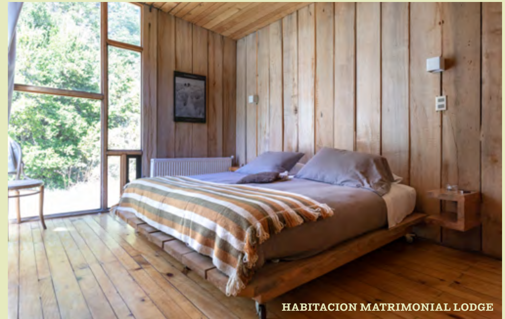
HABITACION MATRIMONIAL LODGE

Vidriada en Termopanel y estufa a leña con una transparencia que invita a habitarla con holgura, en pareja o solitario .