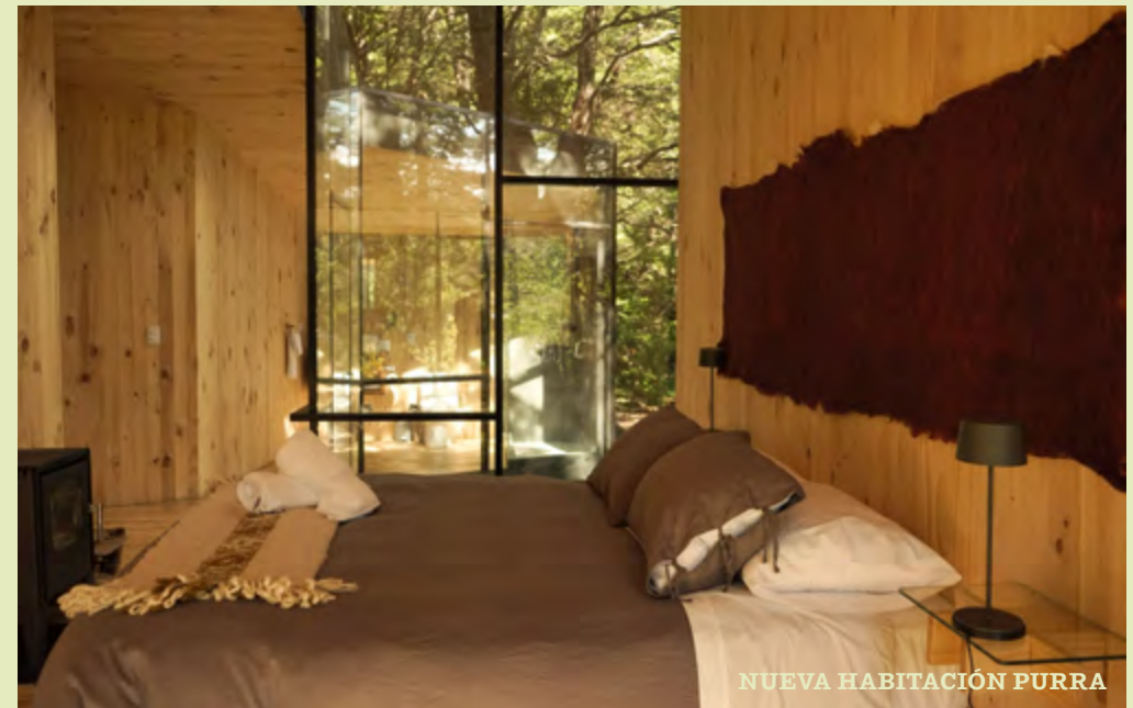
NUEVA HABITACIÓN PURRA

* una habitación de acceso universal Single/doble